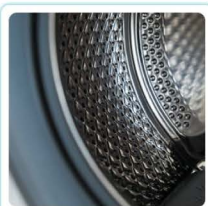
冰箱 / 洗衣機膠條